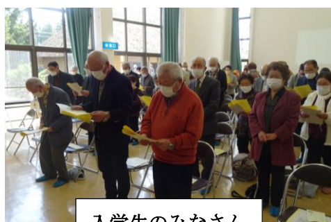
入学生のみなさん

なお、随時受講生を募集していますので、お気軽に市民センターへお問い合わせください。